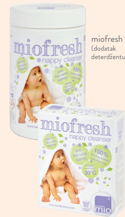
miofresh (dodatak deterdžentu)

Ako dođe do obojenja, povremeno možete namočiti uložak pelene u vrućoj otopini miofresh dodatka deterdžentu najmanje 2 sata. Koristite 30 ml miofresh na svakih 5 litara vode. Nakon namakanja, perite na 40 °C i dodatno isperite nakon toga.†