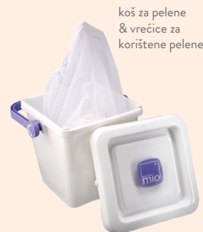
koš za pelene & vrećice za korištene pelene

Koristite koš za pelene za pohranu korištenih pelena prije pranja. Jednostavno ih pohranite na suhom u košu za pelene dok ne budu spremne za pranje. Kada stigne dan za pranje, podignite vrećicu za korištene pelene i lakši prijenos do perlice rublja. Pelene će se oprati u vrećici tako nema potrebe prenositi prljave pelene.